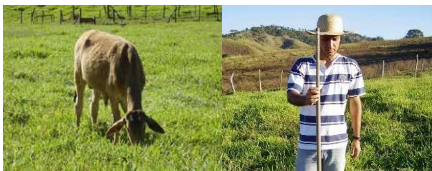
■ Figura 2 - Pasto de capim-braquiariinha diferido por 73 dias em Viçosa, MG, e após 30 dias de período de pastejo, que iniciou no início de julho de 2005: massa de forragem, com muita folha viva e ausência de plantas tombadas 5 .

A produção de ruminantes baseada em pastagem é a forma mais barata de produzir carne e leite. Contudo, a menor produção de forragem no período seco é um impasse para o produtor. Por isso, as ações para contornar esse problema devem ser planejadas e executadas ainda durante a época das águas, a estação de maior crescimento dos capins.