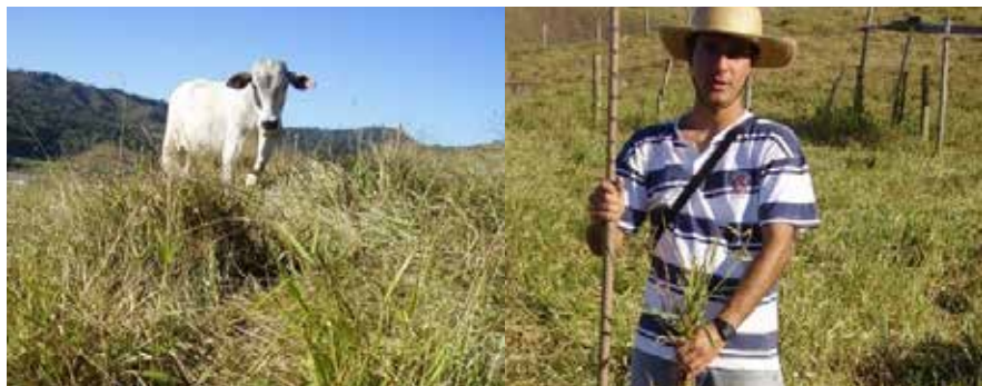
■ Figura 1 - Pasto de capim-braquiariinha diferido por 163 dias em Viçosa, MG, e após 30 dias de período de pastejo, que iniciou no início de julho de 2005: alta massa de forragem, com muita forragem morta e plantas tombadas 5