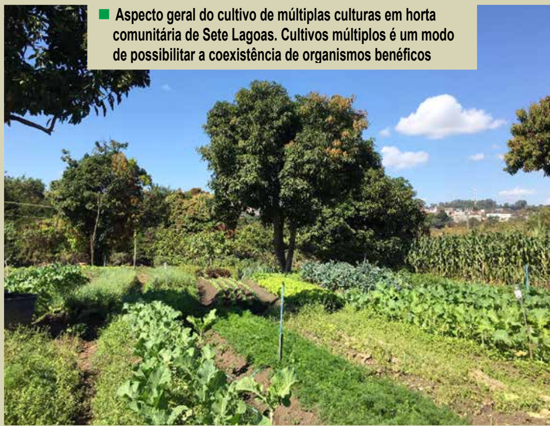
■ Aspecto geral do cultivo de múltiplas culturas em horta comunitária de Sete Lagoas. Cultivos múltiplos é um modo de possibilitar a coexistência de organismos benéficos

O solo fértil, a água e o ar são elementos da paisagem natural, fundamentais, não apenas na produção de alimentos, mas também, para a manutenção dos organismos vivos na Terra. A manutenção dos nutrientes no solo, a disponibilidade de água, o pescado, a lenha como combustível, a polinização de plantas por abelhas, o ataque de joaninhas sobre pulgões na plantação, ou o besouro rola-bosta agregando estrume no pasto são “bens” ou “benefícios” de que dispomos dos ambientes naturais. Eles têm valor econômico direto em nossa produção de alimentos e na qualidade de vida no campo ou na cidade. Quem não se sente bem ao abrir a janela pela manhã e poder ver plantas e ouvir, ao fundo, aves cantando?