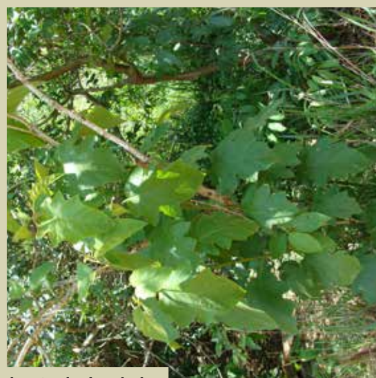
■ Flores, frutos e arbusto da Jurubeba