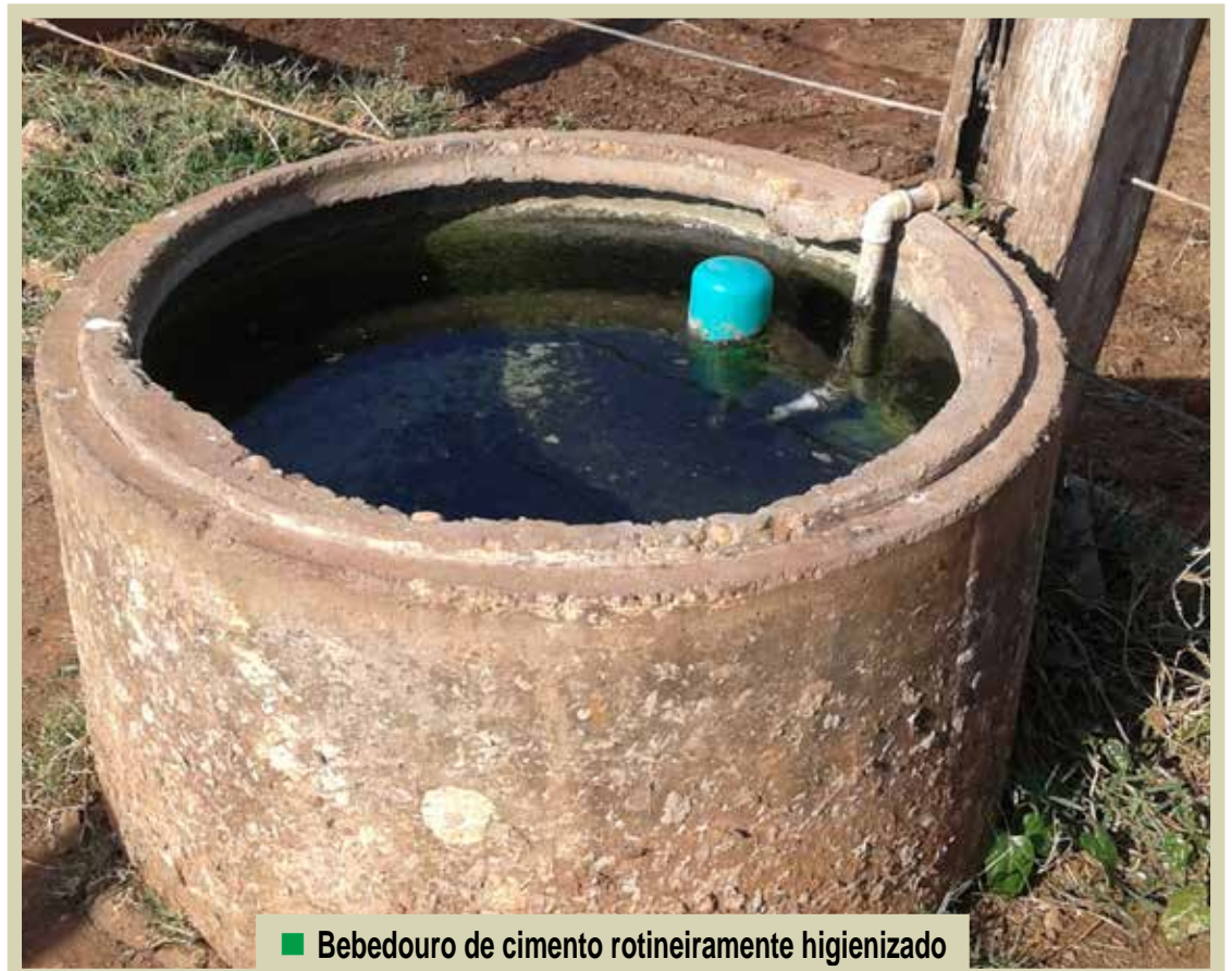
■ Bebedouro de cimento rotineiramente higienizado

por vacas leiteiras reduz o desempenho mais rápido e de maneira mais drástica que qualquer déficit nutricional.