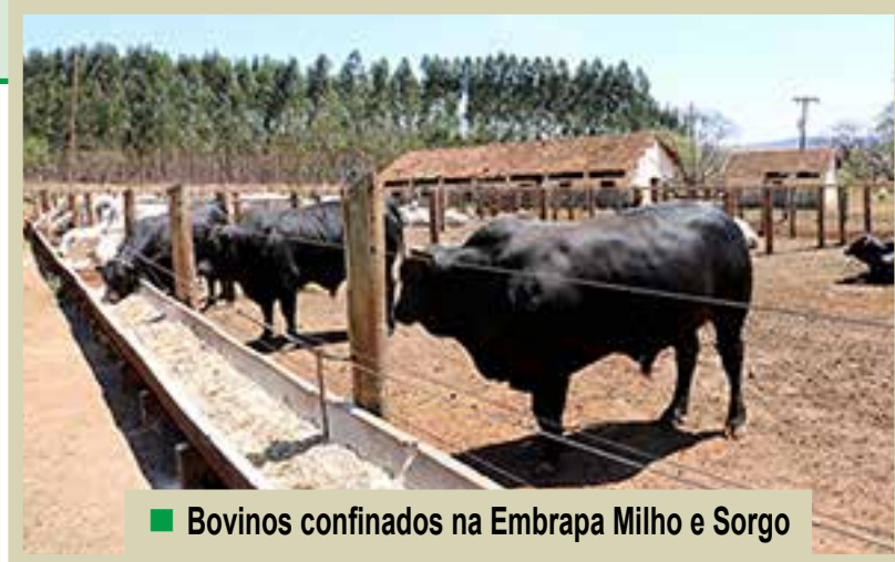
■ Bovinos confinados na Embrapa Milho e Sorgo