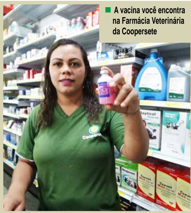
■ A vacina você encontra na Farmácia Veterinária da Coopersete

O produtor rural deve comunicar imediatamente ao IMA o aparecimento de animais com sintomas nervosos, babando, com dificuldade de locomoção, paralisia (principalmente nas patas traseiras), dificuldade de urinar e