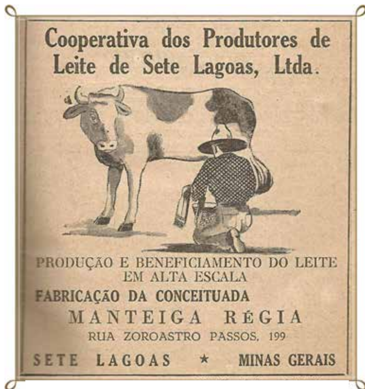
■ Anúncio da Cooperativa publicado na Revista Acaiaca, no ano de 1954