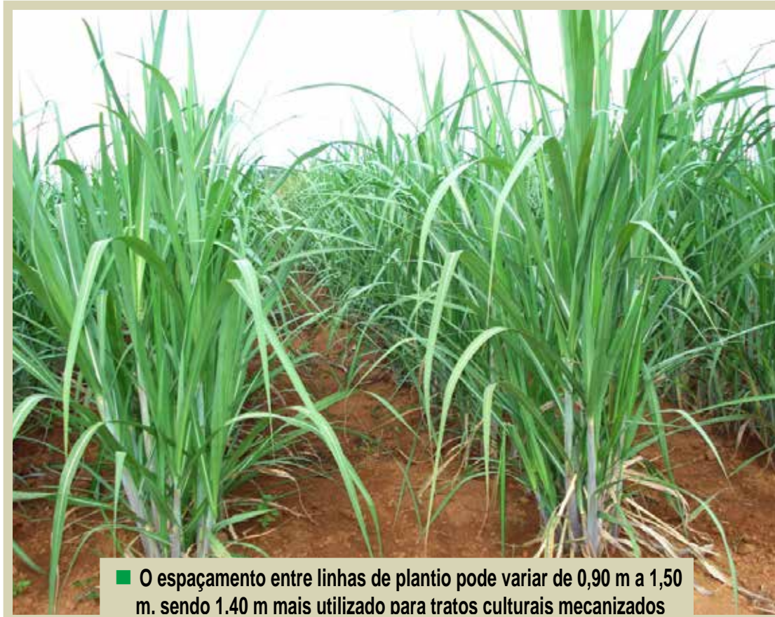
■ O espaçamento entre linhas de plantio pode variar de 0,90 m a 1,50 m, sendo 1,40 m mais utilizado para tratos culturais mecanizados

✓ Outra opção são as mudas pré-brotadas (MPB), produzidas a partir de minirrebolos com gemas, colocados em tubetes para brotar, constituindo-se em opção para formação de viveiros